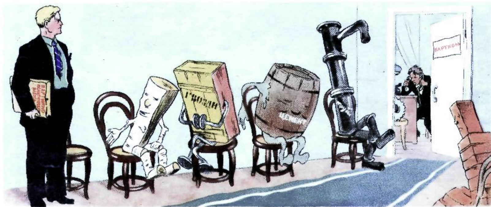
В порядке живой очереди.