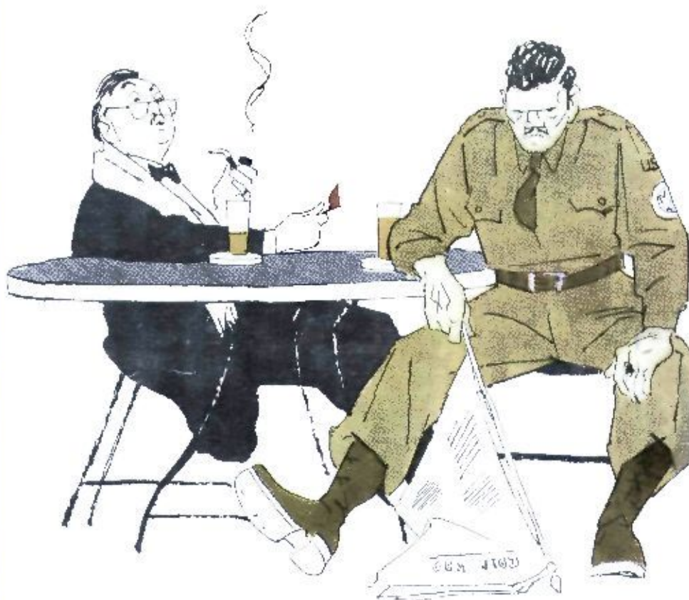
Рис. Д. СОЙФЕРТИСА (по теме читателя С. Соколова, Ленинград)

(Из парижского журнала «Демокраси нувель».)