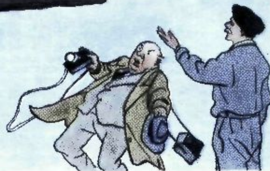
— Да! Вот она!