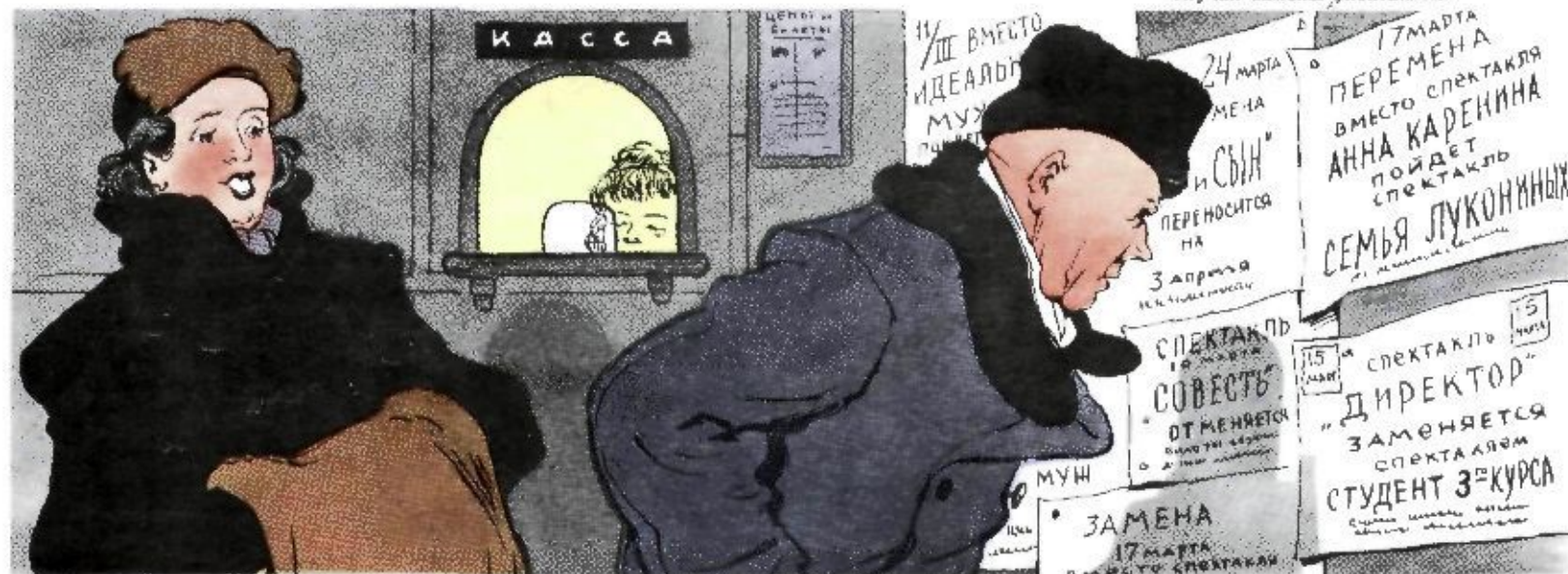
Рис. В. ИОНОВАЛОВА

— Что ты задумался! — Соображаю, на что взять билеты, чтобы попасть в конце концов на «Совесть»!