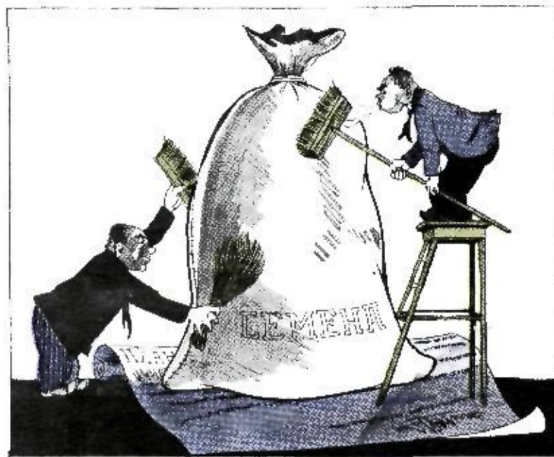
Поверхностное отношение к очистке семян.

В Ульяновском районе, Нальужской области, плохо готовят сортовые семена к севу.