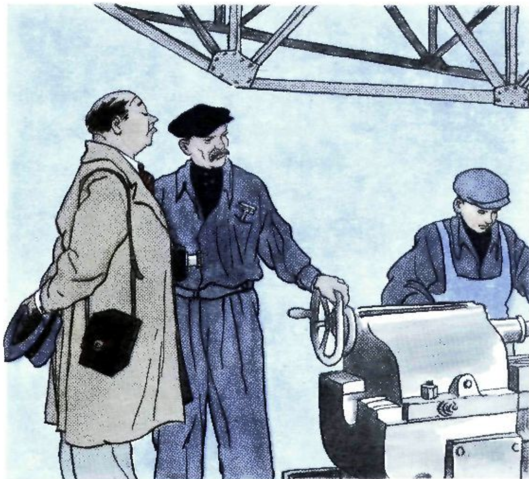
— Этот стахановец сэкономил металла на одну деталь! — Всего!

Не правда ли, как усложнился вопрос, Который, бесспорно, и ясен и прост: Монтер должен быть и по штату монтером, А не медсестрой или, скажем, вахтером, Шофёр не курьером, а только шофёром, Директор — директором, а не жонглёром!