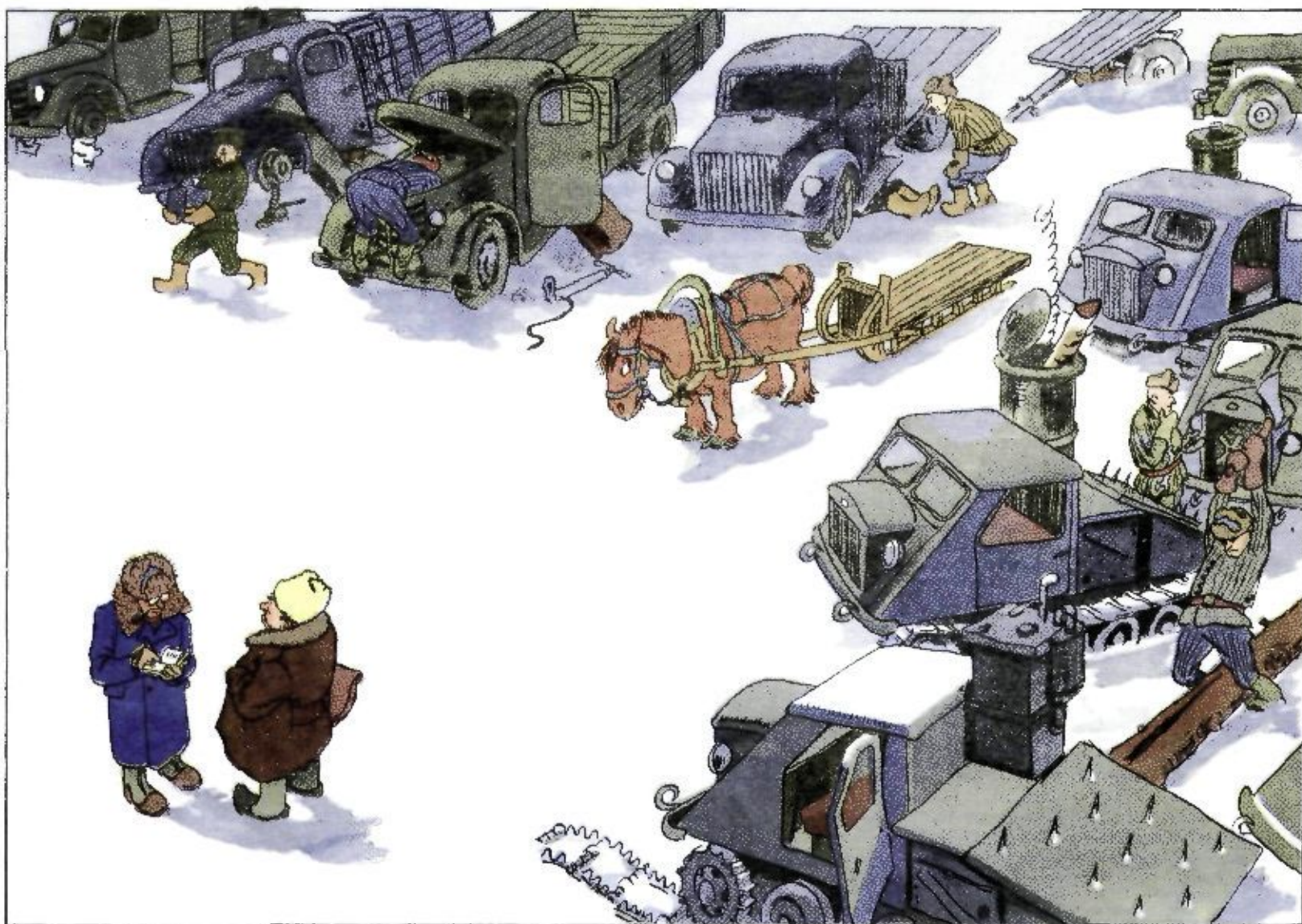
Рис. Е. ВЕДЕРНИКОВА

— Зачем вам нужен конь в таком механизированном лесхозе? — Как зачем! А лес-то на чём возить?