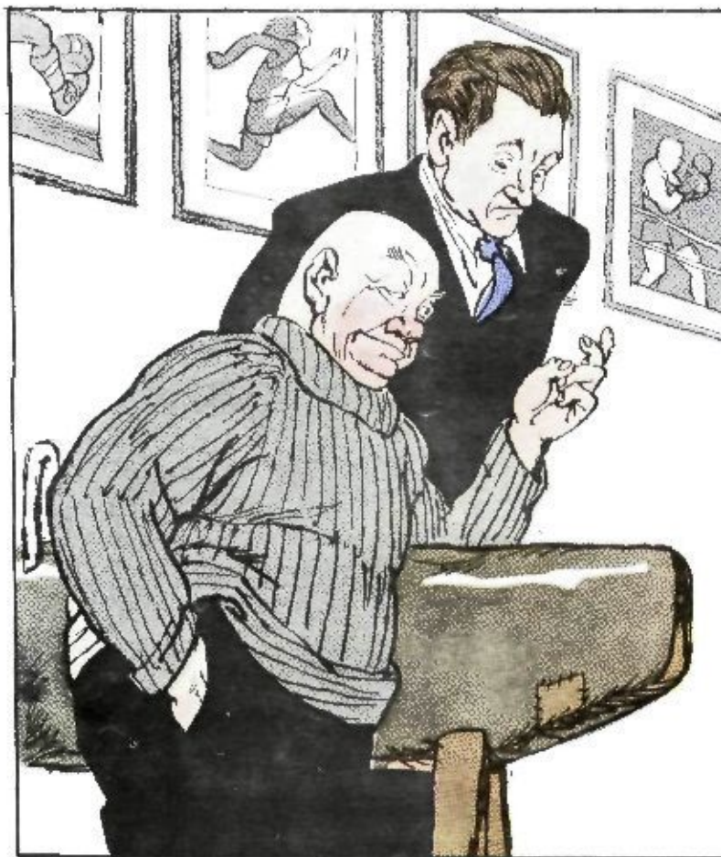
Рис. Ю. УЗВЯКОВА

— Много молодых, способных спортсменов привлечено в наше общество!